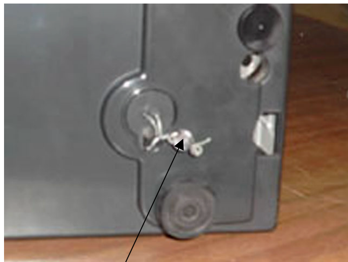
Zaštitni žig za kliješta