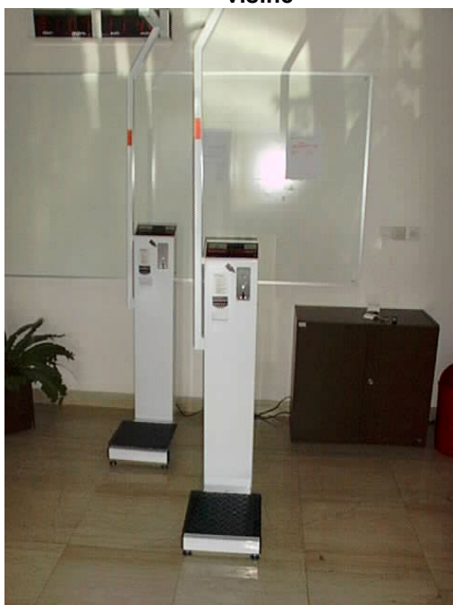
Izgled osobnih vaga tip C/I-T s ultrazvučnim indikatorom visine